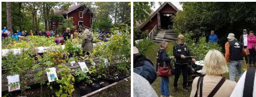
Kuvat Mustilan taimipäiviltä edellisen vuoden tapahtumasta